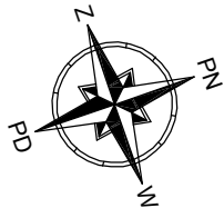
POŁOŻENIE LOKALU W BUDYNKU